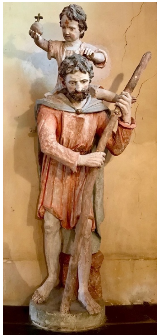
Saint-Christophe, bois polychrome XVIIe siècle