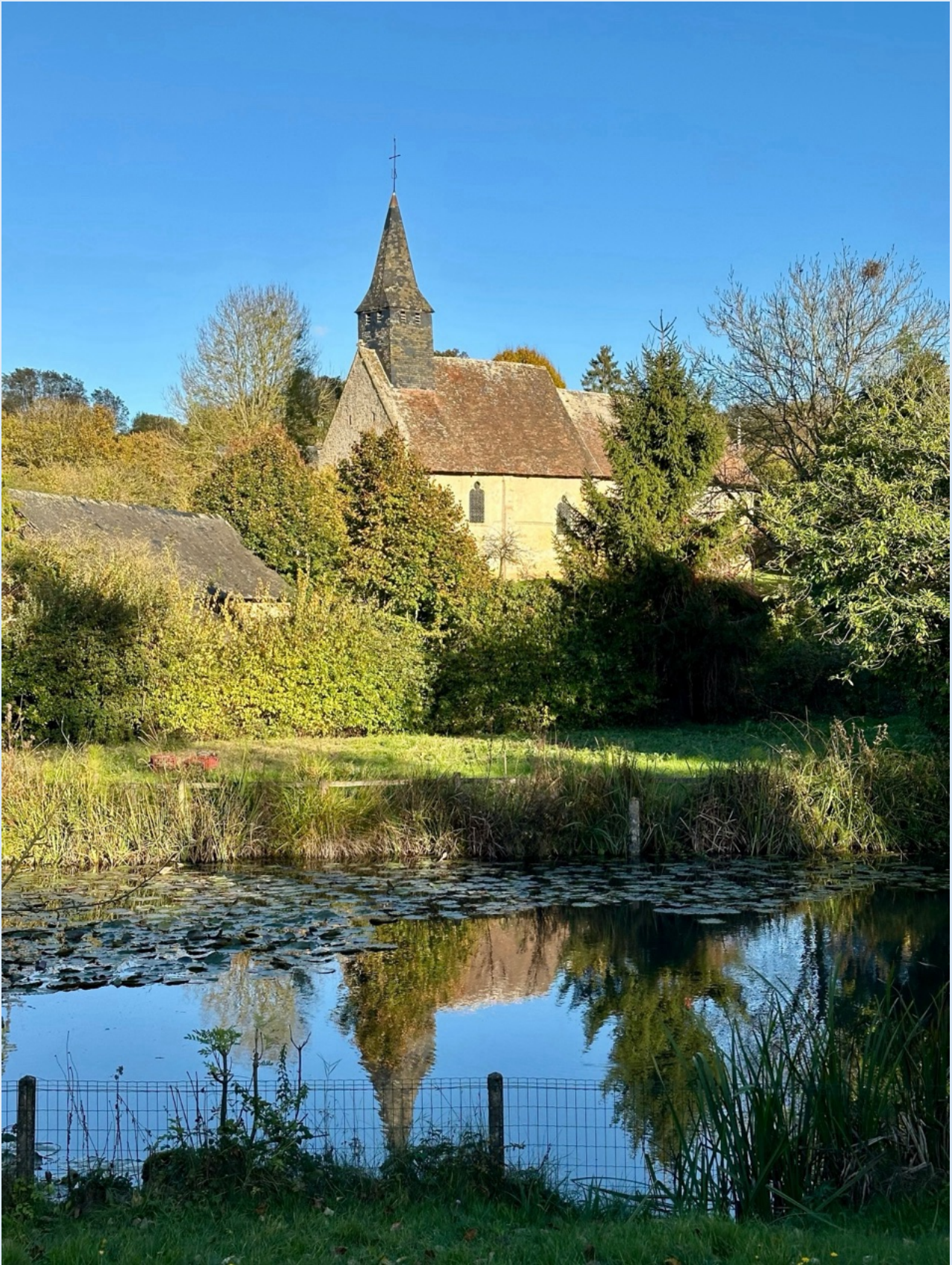
Église de Grandouet (Cambremer)