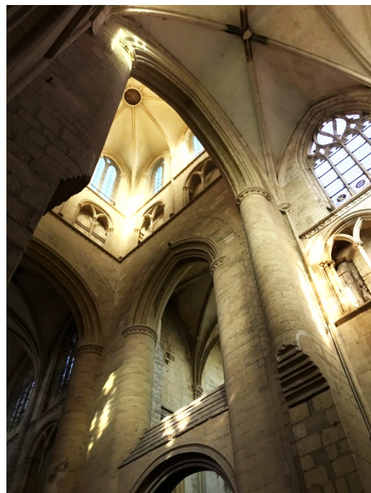
La lumière de la tour lanterne

Pour finir la saison des visites, voici l'un des navires amiraux du Pays d'Auge. L'abbatiale Saint-Pierre témoigne de la puissance passée de l'un des plus anciens monastères bénédictins de la région. On admirera entre autres trésors, le pavement du XIIIe siècle et les stalles et boiseries du début du XVIe siècle dans le chœur.