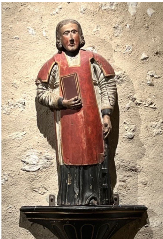
Statue de Saint-Laurent, bois polychrome, XVIIe siècle