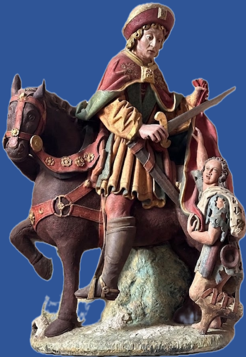
Église de Saint-Martin-aux-Chartrains La Charité de Saint-Martin