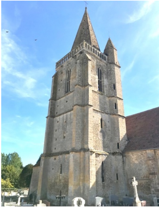
La tour clocher à Thiéville