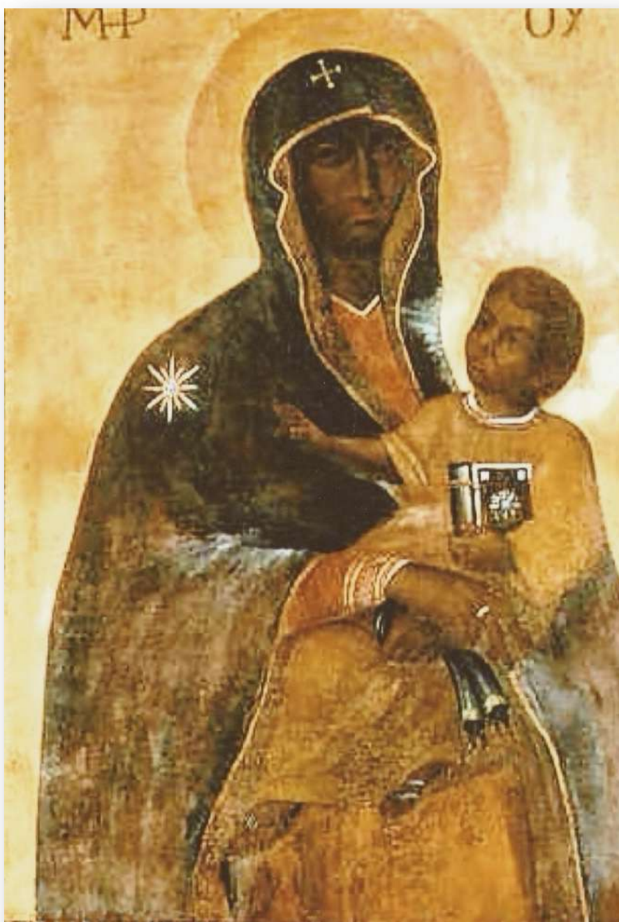
La Vierge noire