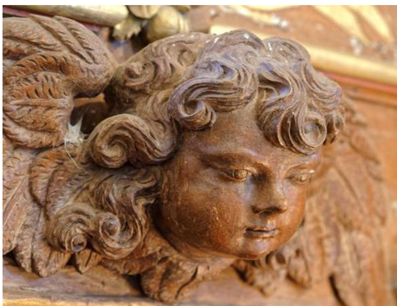
Boiserie du retable du maitre-autel, Prêtreville