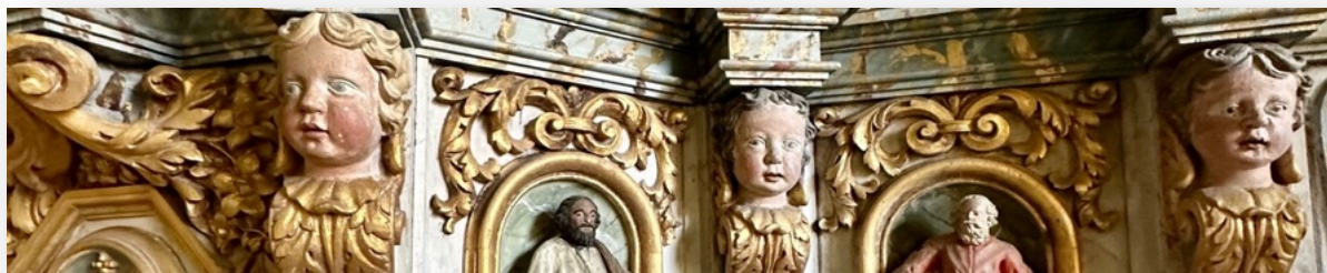
Anges du tabernacle de l'église Notre-Dame de Druval