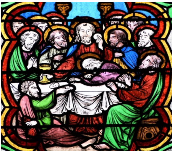
Cathédrale de Lisieux, chapelle Saint-Martin, La Cène