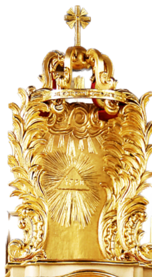
Saint-Germain de Biéville, exposition