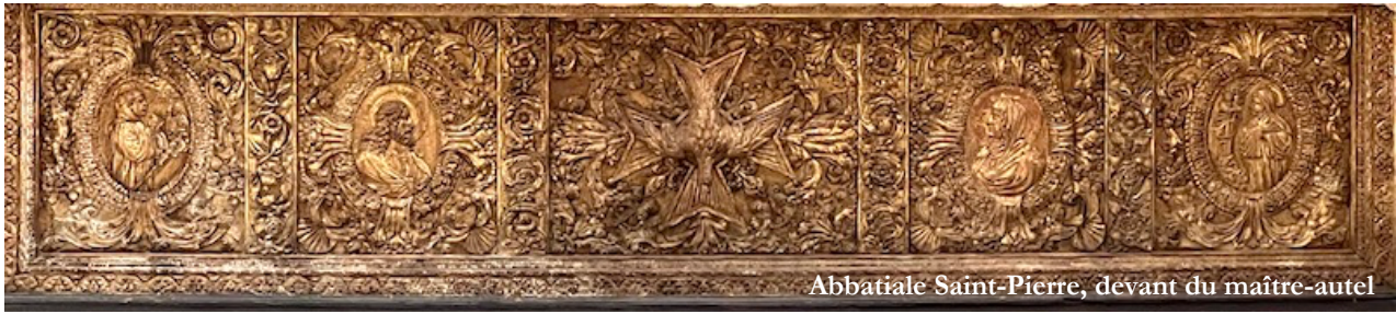
Abbatiale Saint-Pierre, devant du maître-autel